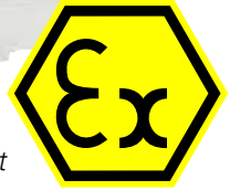
FLIR A310 ex auf Wunsch mit Sonnenblende erhältlich