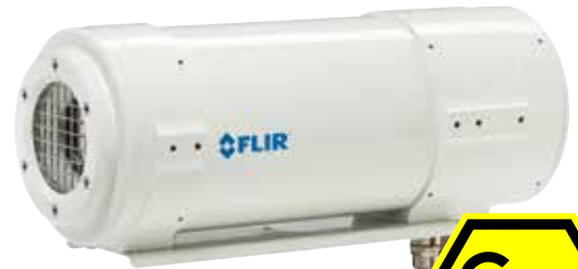
FLIR A310 ex (ohne Sonnenblende)