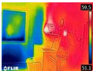
Nicht isolierte Außenwand

Das FLIR C2 umfasst FLIR's revolutionäre Lepton® Mikro-Wärmebildkamera, die einen Bereich passiv überprüfen und Bilder von Wärme- und Kältemustern auf dem LCD-Bildschirm anzeigen kann. Neben der Lepton gehört zum C2 auch eine Tageslichtkamera, um Fotos von der Szene zu machen. Mit FLIR's exklusiver MSX®-Technologie C2 werden die Wärmekontrastdetails von der Tageslichtkamera auf das Wärmebild übernommen, ohne es abzuschwächen. Das Resultat ist ein Wärmebild, das identifizierbare Merkmale, Zahlen, Buchstaben und andere Texturen zeigt. So wissen Sie sofort, was Sie in einer bestimmten Szene sehen.