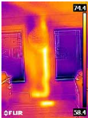
Warmes Abflussrohr in der Wand