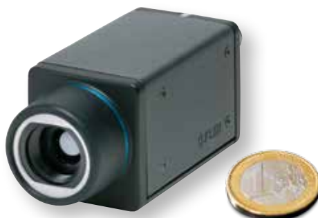
Die kompakte Wärmebildkamera FLIR Ax5 sc

Die FLIR Axx sc Serie ist standardmäßig kompatibel zu GigE Vision™. GigE Vision ist ein wichtiger Standard für Kameraschnittstellen, der unter Verwendung des Gigabit-Ethernet-Kommunikationsprotokolls entwickelt wurde. Auch das GenICam™-Protokoll wird unterstützt. GenICam hat zum Ziel, eine allgemeine Programmier- und Kommunikationsschnittstelle für alle Arten von Kameras bereitzustellen. Unabhängig von der Schnittstellen-Technologie (GigE Vision, Camera Link, 1394 DCAM usw.) oder den implementierten Funktionen wird die Schnittstelle für die Anwendungsprogrammierung (API) dabei immer dieselbe sein.