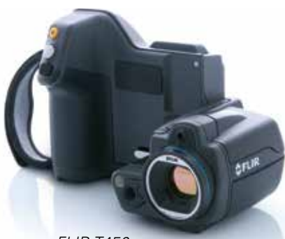
FLIR T450 sc

Dank einer drehbaren Bedieneinheit mit Touchscreen kann der Anwender die Kamera in der für ihn bequemsten Position verwenden. Die Tasten und der Joystick zur Bedienung der Kamera sind in dieser Einheit integriert und bleiben immer direkt unter den Fingerspitzen. Ein qualitativ hochwertiger LCD-Touchscreen mit Stift setzt neue Maßstäbe bezüglich Interaktivität und Benutzerkomfort und lässt selbst kleinste Temperaturunterschiede gut erkennen.