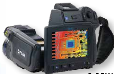
FLIR T650 sc